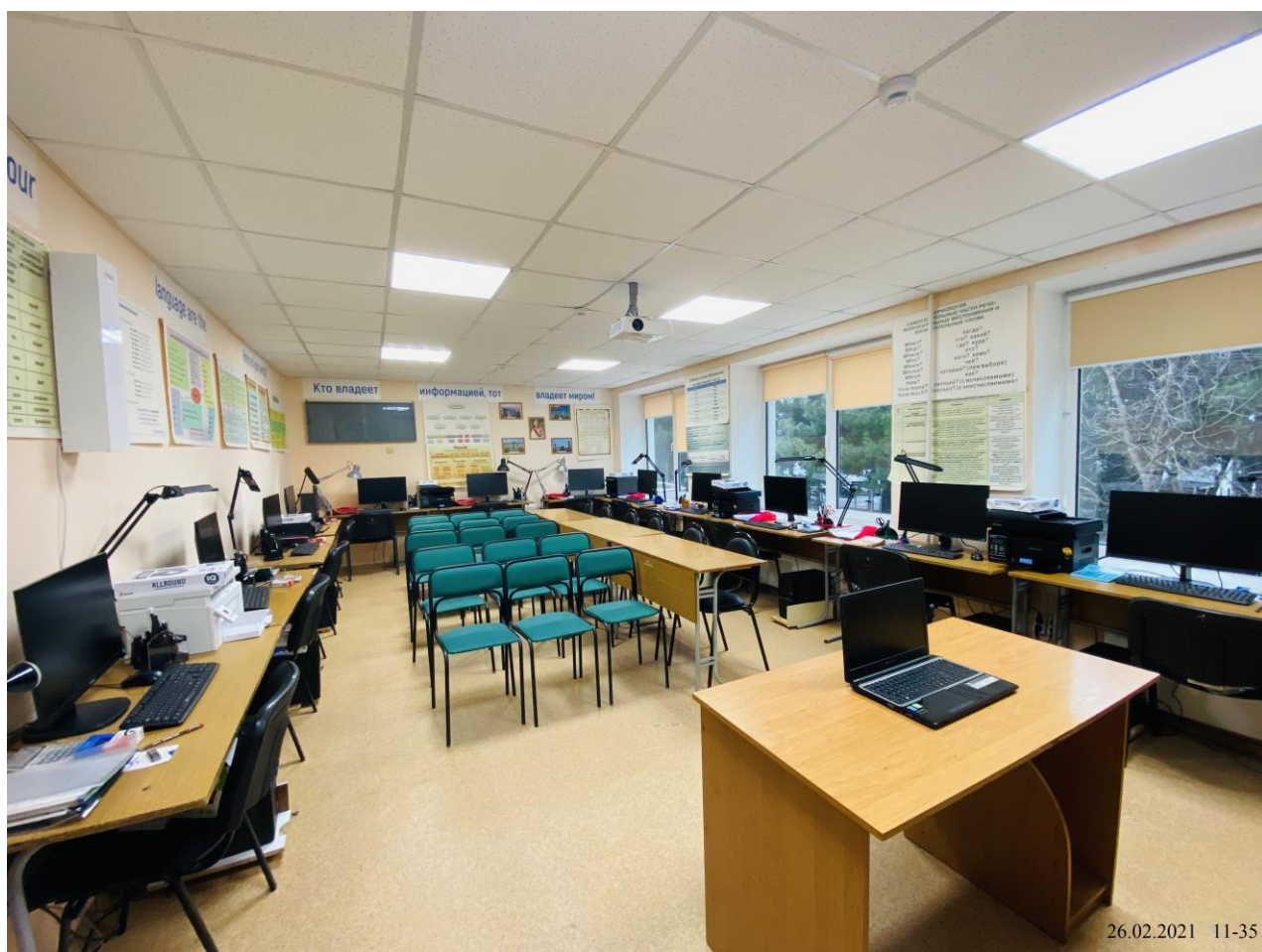
Центр проведения демонстрационного экзамена по компетенции «Бухгалтерский учет»