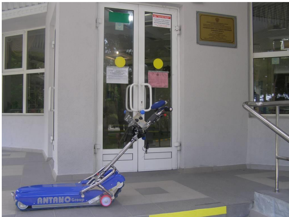
Гусеничный подъемник для инвалидов LG 2004 для беспрепятственного передвижения по лестнице