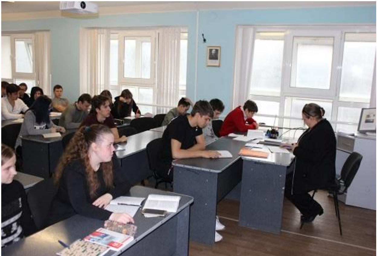
Аудитория № 9