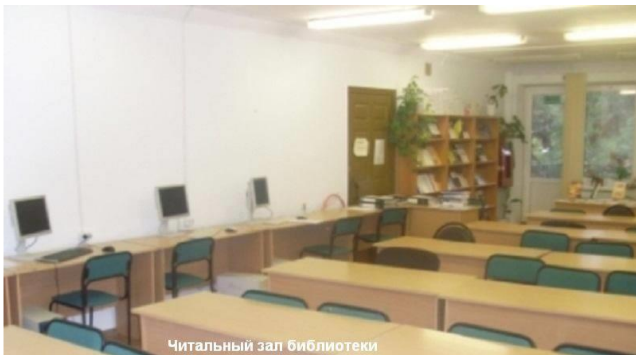
Читальный зал библиотеки