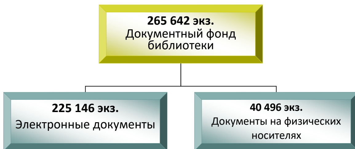
Рисунок 1. Документный состав библиотечного фонда.

Библиотечный фонд филиала – составная часть общего фонда Научной библиотеки КубГУ (НБ КубГУ) – универсального, многоотраслевого собрания различных видов и типов отечественных и зарубежных изданий. В составе фонда – издания на физических носителях и электронные издания удалённого доступа (Рис. 1).