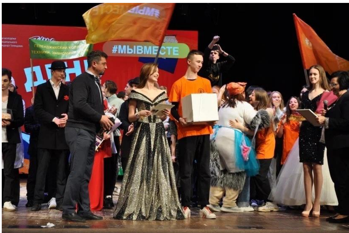
Конкурс «Мисс студенчество»

День открытых дверей, День знаний, День первокурсника, Церемония посвящения в студенты, празднование дня рождения филиала ФГБОУ ВО «Кубанский государственный университет» в г. Геленджике, Новогодняя перезагрузка, «Мисс студенчество», интеллектуальная игра "Что? Где? Когда", организация и участие в спортивном фестивале «ГТО».